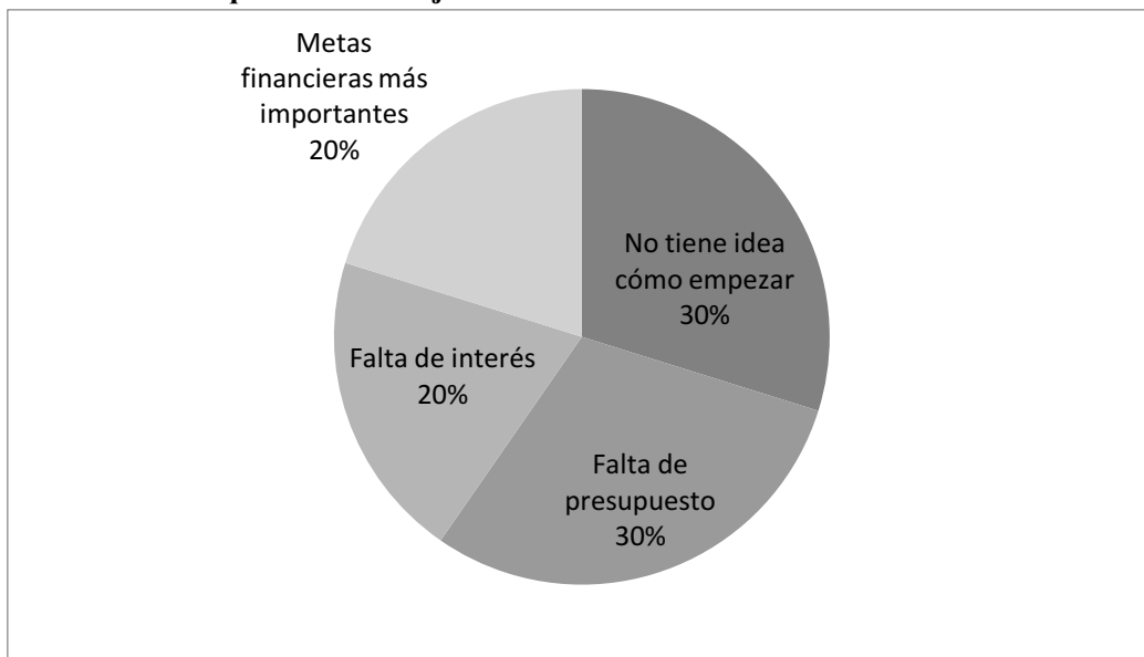
Gráfica 2. Por qué no se trabaja en RSE